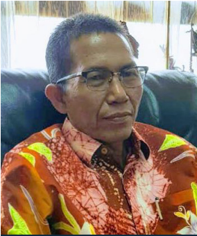
AMSAKAR ACHMAD Wakil Walikota Batam