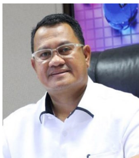
EFRIUS Kabag Humas Setdako Batam

tegas, bertindak cepat, sederhana apa adanya. Namun, selalu ada solusi di setiap permasalahan yang dihadapi. Beliau tidak mau masalah di masyarakat dan pemerintahan tidak ada solusi, harus tuntas. Apa yang beliau kerjakan tidak memikirkan satu dua tahun saja, tapi puluhan tahun ke depan. Beliau mengajarkan kami untuk terus bekerja “berlari” dan berinovasi untuk kepentingan masyarakat.